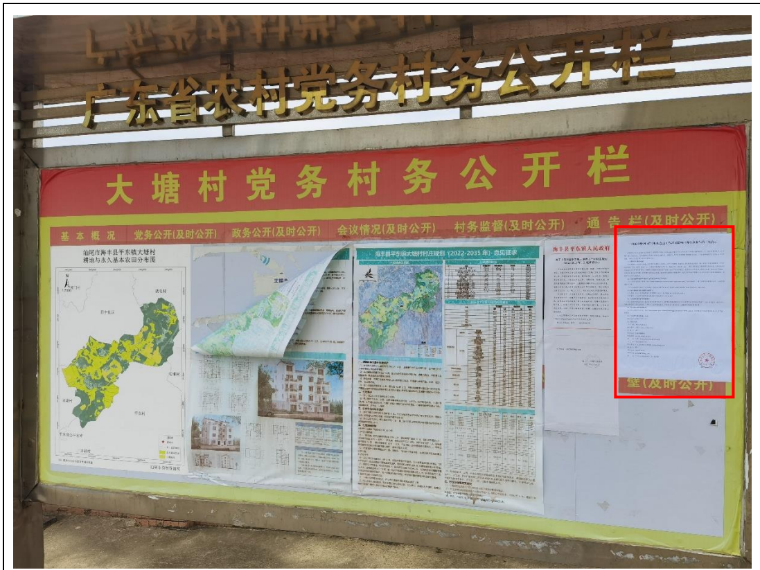
项目沿线所在地汕尾市海丰县平东镇大塘村村委会宣传栏张贴公告