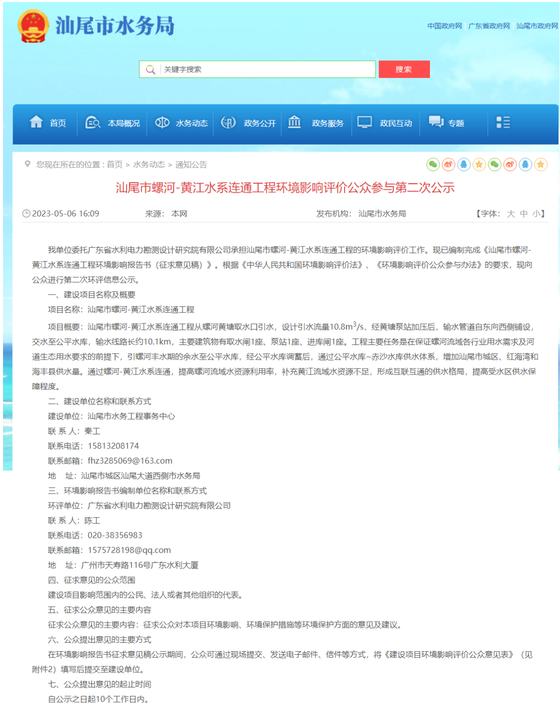
图 3.2-1 2023 年 5 月 6 日在汕尾市水务局网站第二次公示截图