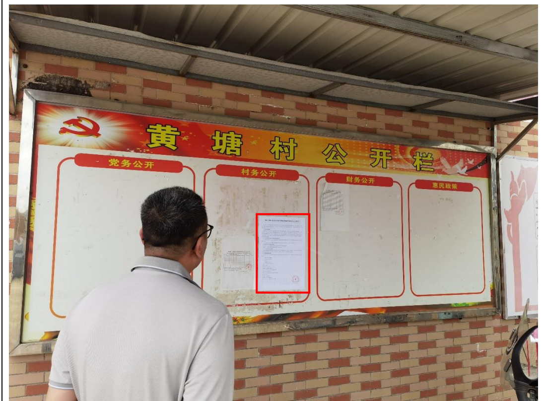
项目沿线所在地汕尾市陆丰市西南镇黄塘村村委会宣传栏张贴公告