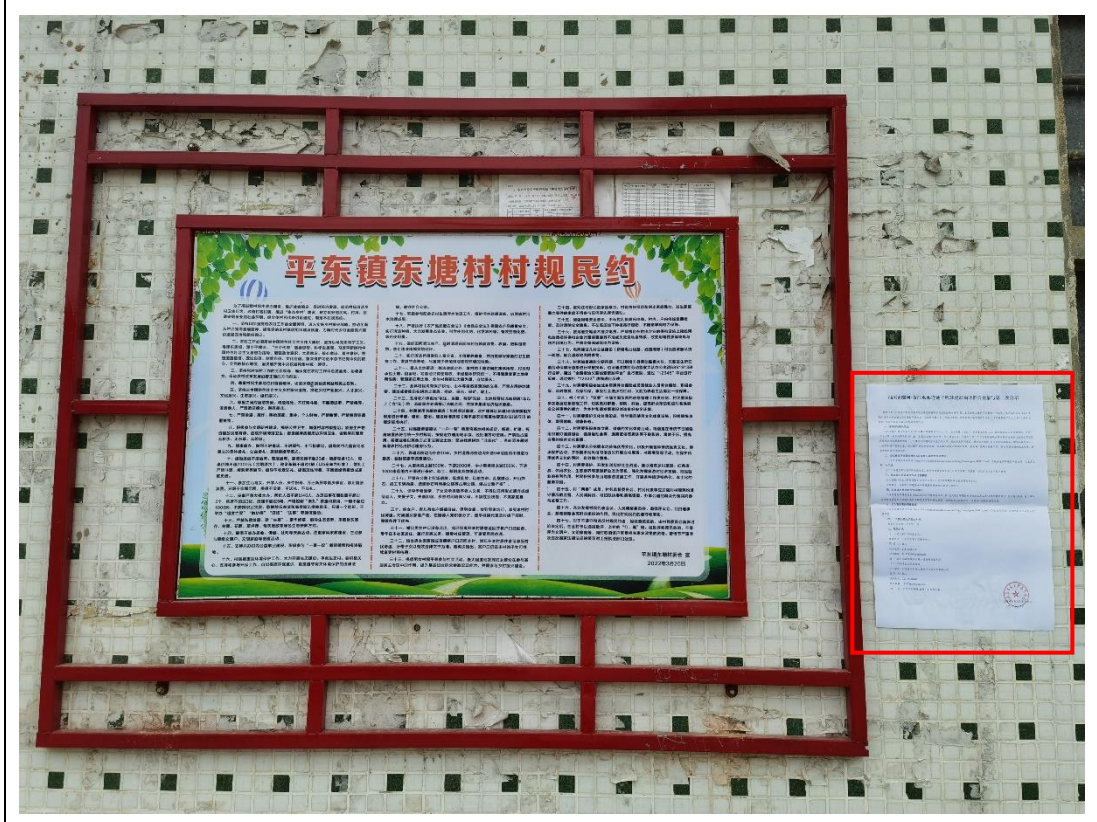
项目沿线所在地汕尾市海丰县平东镇东塘村村委会宣传栏张贴公告