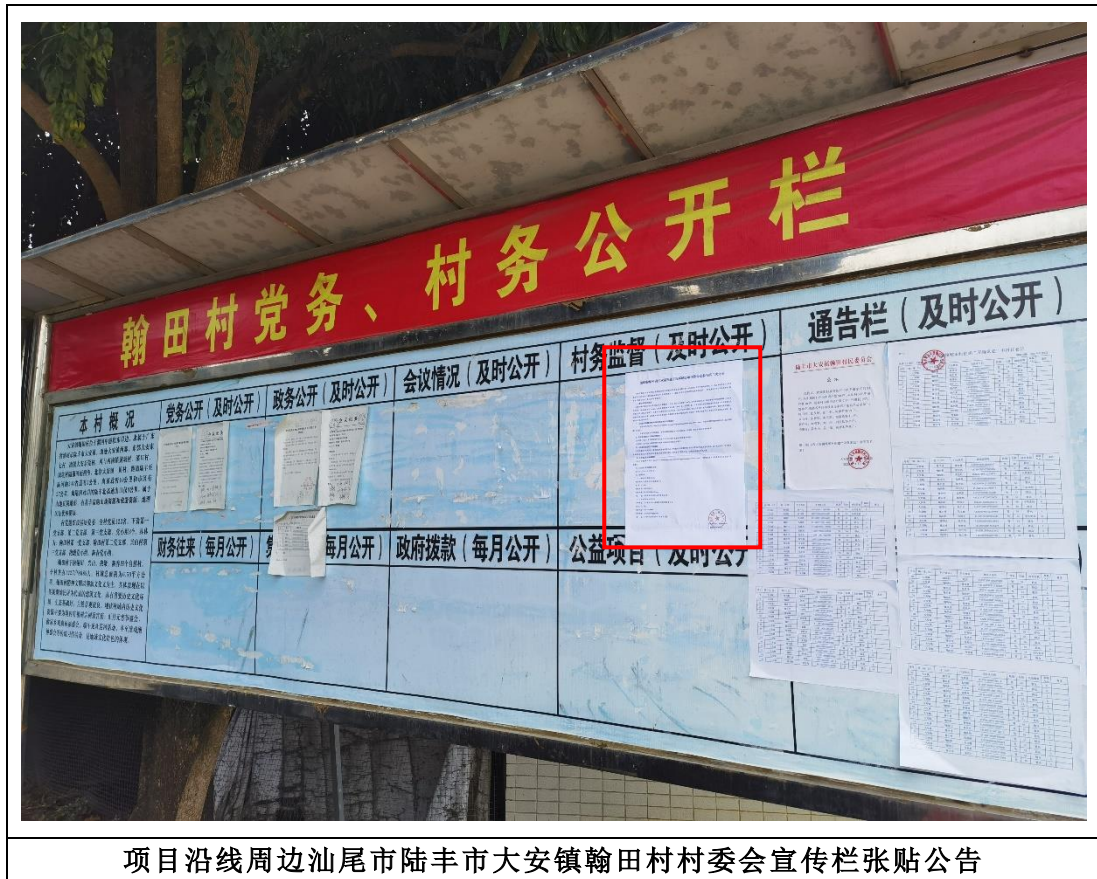
项目沿线周边汕尾市陆丰市大安镇翰田村村委会宣传栏张贴公告