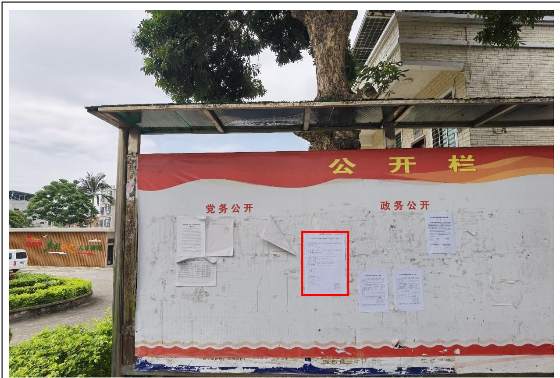
项目沿线所在地汕尾市陆丰市西南镇镇政府宣传栏张贴公告