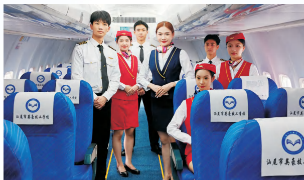
航空、铁路客运乘务礼仪社