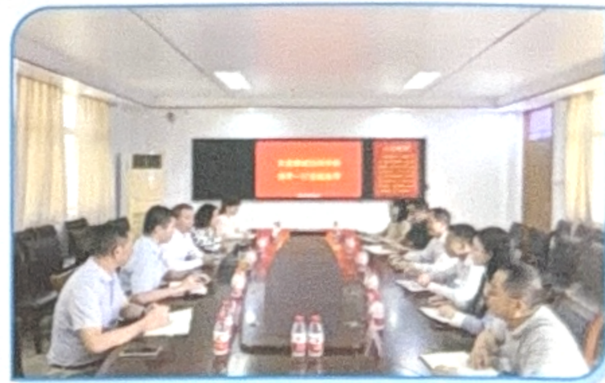
深圳鹏城技师学院到我校开展合作交流活动