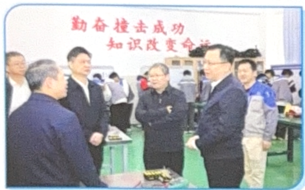
省人力资源和社会保障厅党组书记、厅长杜敏琪一行在汕尾、陆丰两级领导陪同下莅临我校指导工作

陆丰市技工学校创办于1987年，是一所经原省计委批办的全日制公办技工学校。目前已发展成集学历教育、培训就业、职业技能培训和公职人员在岗培训等为一体的综合性人才培养基地。开设有计算机网络应用、电子商务、烹饪、幼儿教育、汽车维修、新能源汽车检测与维修等主干专业，在校生1000多人。近年来，与深圳鹏城技师学院、广东交通职业技术学院、广东省粤东技师学院和汕头技师学院开展联合办学、对接帮扶，共同打造较强的主干专业和师资队伍。