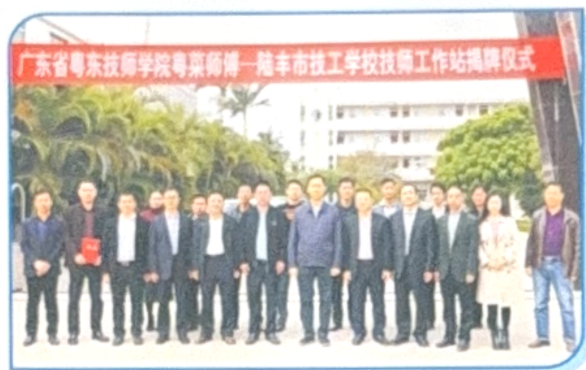
广东省粤东技师学院粤菜师傅——陆丰市技工学校技师工作站揭牌仪式