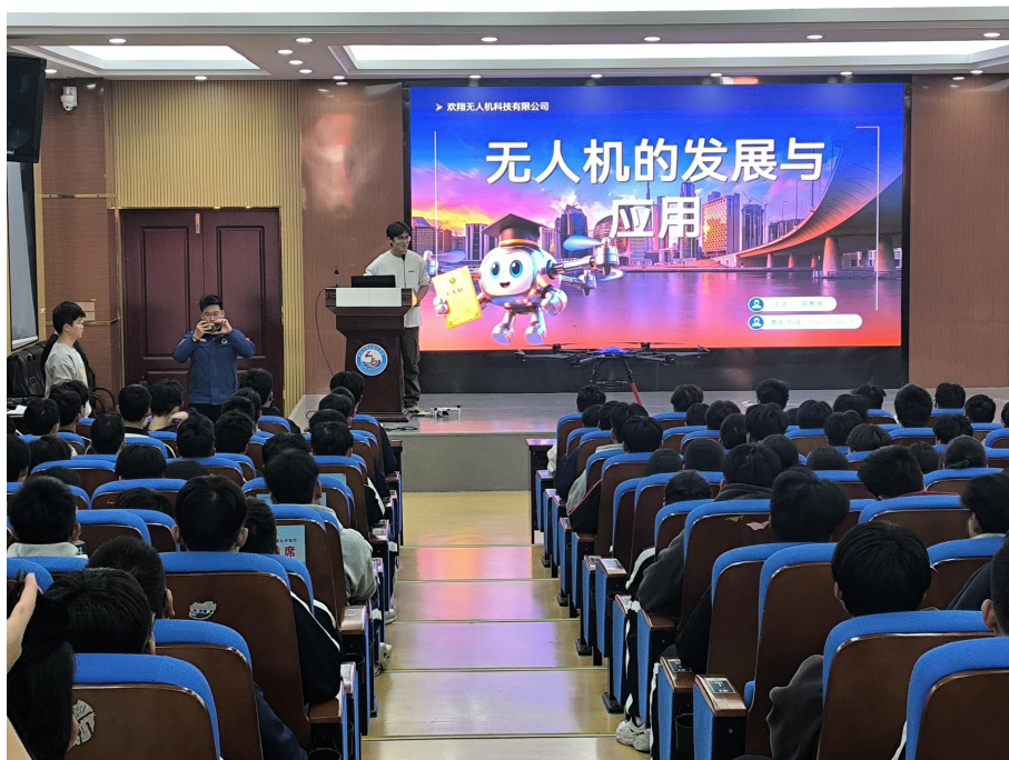
图 6-3 企业来校开展讲座