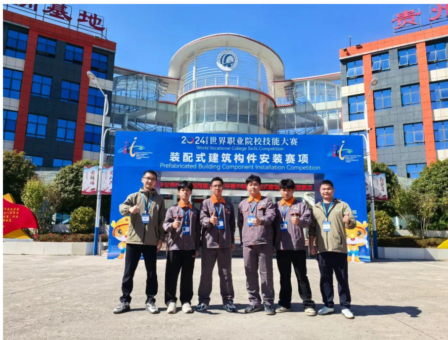
图 4-1 2024 年世界职业院校技能大赛总决赛争夺赛