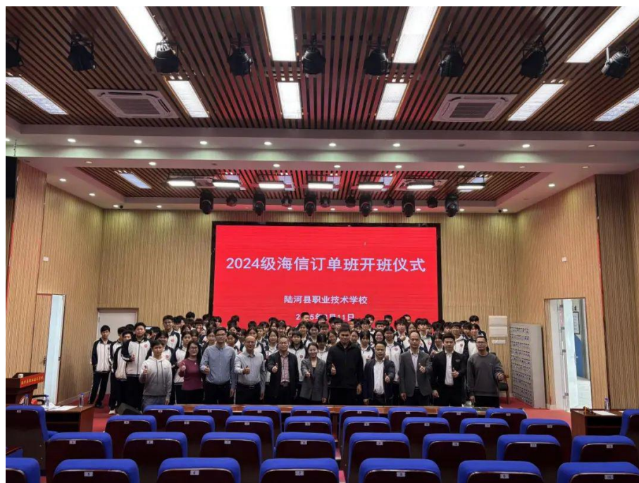
图6-1 订单班开班仪式

培养模式的重要举措，旨在通过校企合作，为学生提供更贴近行业需求的实践机会，为企业输送高素质技能型人才。