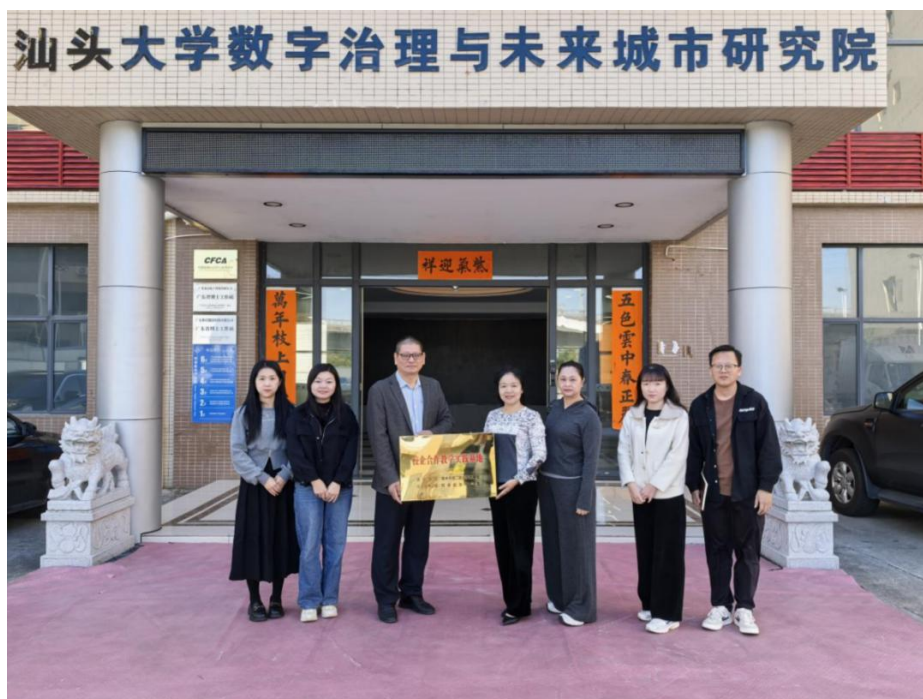
图6-2 陆丰市第二职业技术学校与诺数字产业园共建教学实践基地

基地的建立为学校相关专业提供了稳定的校外实践平台。它促进了教学内容与企业真实项目的对接，为学生接触行业前沿技术、积累实践经验创造了条件，是推动产教融合落地、实现校企共赢的重要举措。