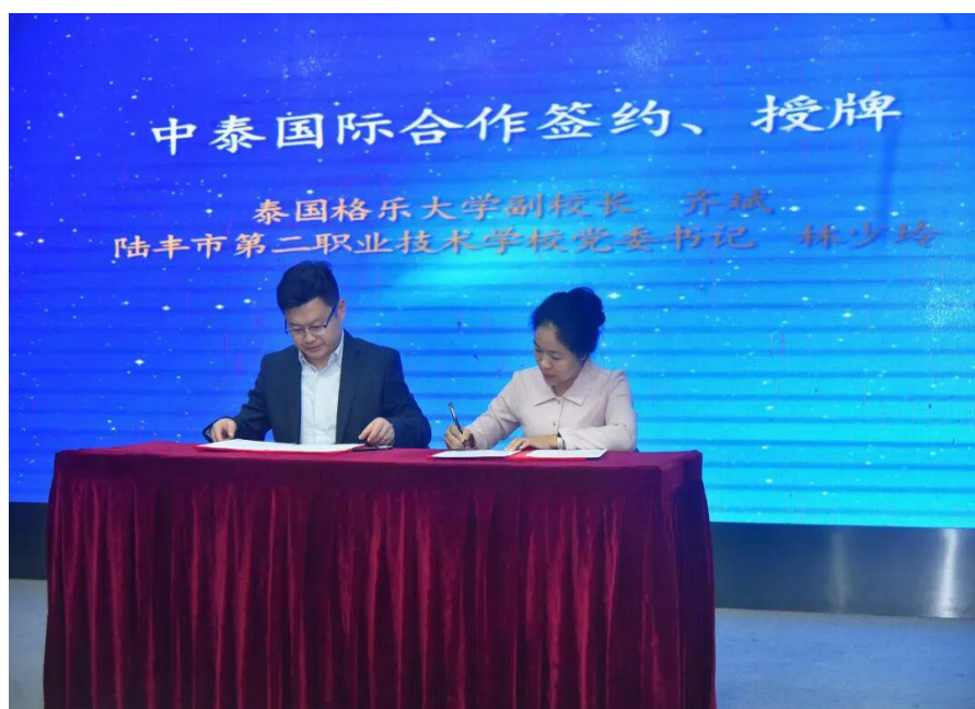
图 5-1 与泰、韩大学签署国际合作办学协议

2025 年 11 月 20 日，陆丰市第二职业技术学校在大湾区职业教育国际合作签约仪式上，与泰国格乐大学、韩国永进专门大学正式签署合作协议。此次签约是学校融入湾区、对接国际高教资源的具体成果。它为学生获取海外学历、接受国际化教育提供了官方可靠的路径，显著拓宽了学生的成长发展空间，提升了学校的国际形象与合作层次。