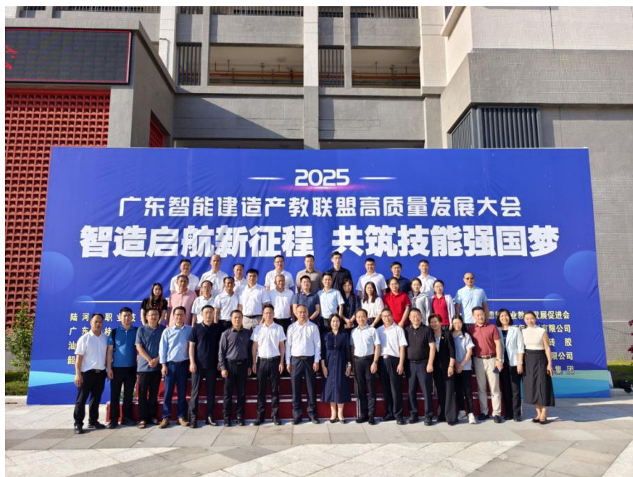
图2-6智能建造产教联盟高质量发展大会合影