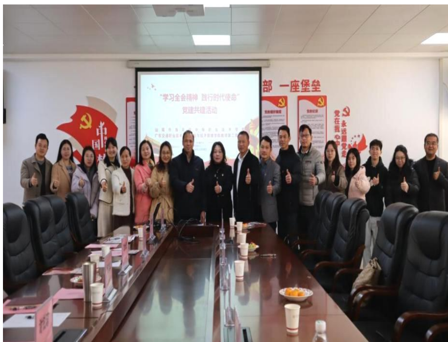
图7-1开展“学习全会精神，践行时代使命”党建共建