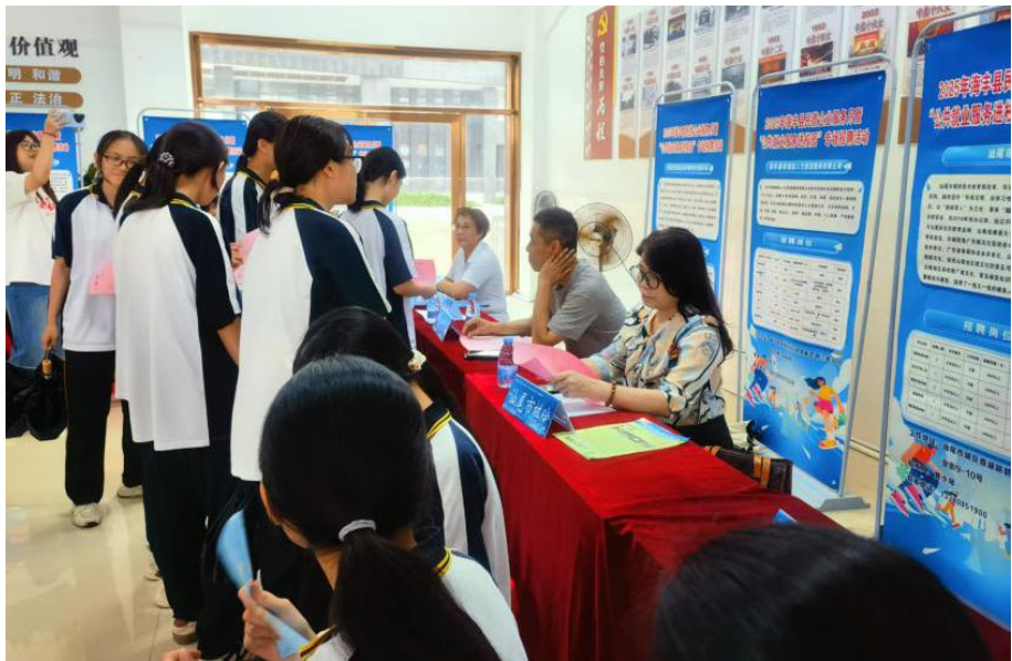
图 3-2 学生参加“南粤春暖”企业用工招聘会