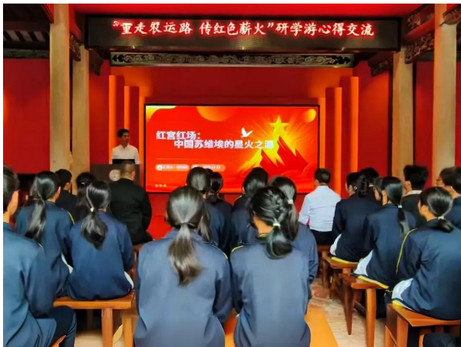
图2-2 缅怀先烈铸忠魂 红色精神永传承