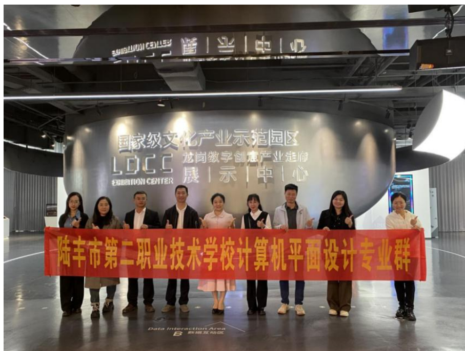
图6-4 设计专业教师赴深圳考察文创产业

此次考察是一场前沿的设计思维与产业认知更新之旅。教师们亲身感受了文创产业的蓬勃生态与数字技术的创新应用，获得了丰富的教学灵感与行业资讯，为更新课程内容、贴近产业需求奠定了基础。