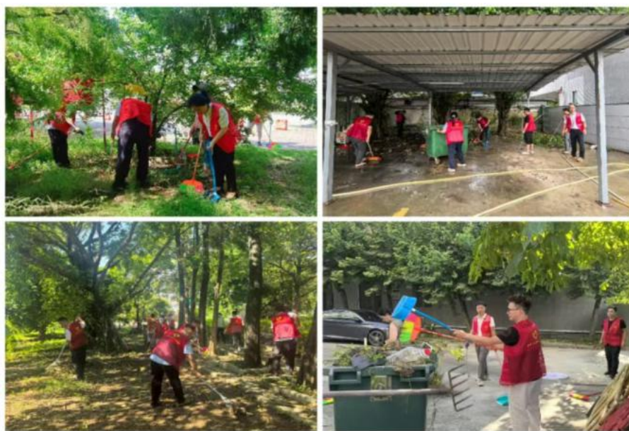
图 7-2 党员开展校园大规模清洁活动

2025 年暑期，为应对蚊媒传染病风险，保障新学期顺利开学，陆丰第二职业技术学校党总支组织发动党员教师带头开展爱国卫生运动。党员教师们冲锋在前，利用休息时间，全面清理校园卫生死角、清运垃圾、修剪过于茂密的绿植，并系统排查积水点，配合专业团队进行科学消杀。通过党员带头、全员参与，有效切断了蚊虫孳生环境，显著降低了校园蚊虫密度，为师生营造了一个安全、整洁、健康的开学环境。这一行动生动诠释了党员“平常时候看得出来、关键时刻站得出来”的先锋本色，是“党建+服务”模式的生动实践。