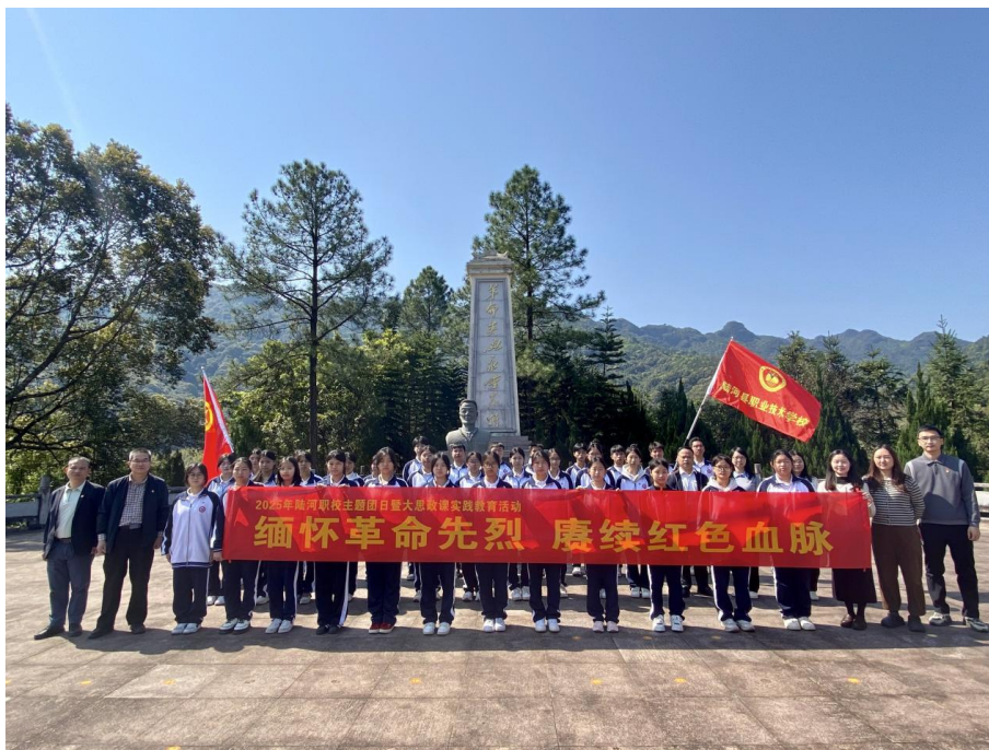
图2-1 陆河县职业技术学校沉浸式红色实践育人活动合影