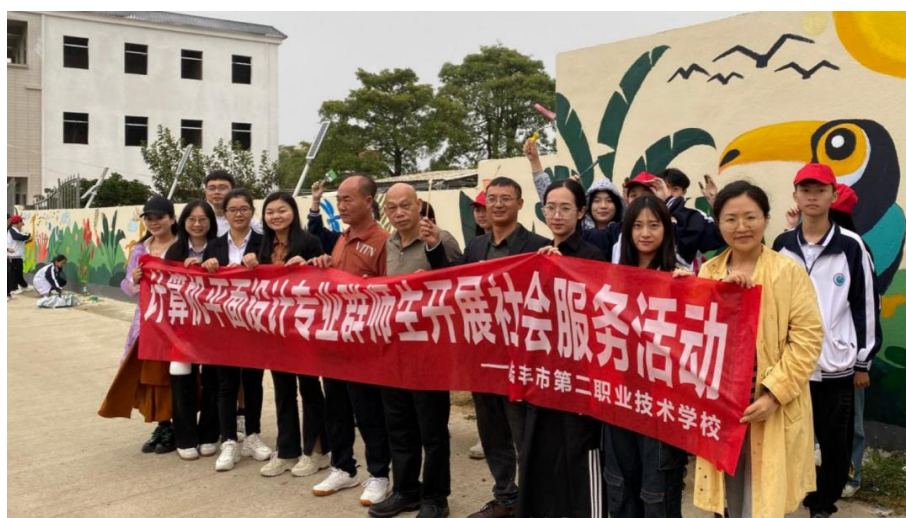
图2-3墙绘实践活动合影

境，提升了乡村文化品位，更让学生在贡献社会中深化了专业认同，增强了服务地方的责任感与自豪感，是职业教育服务“百千万工程”的生动写照。