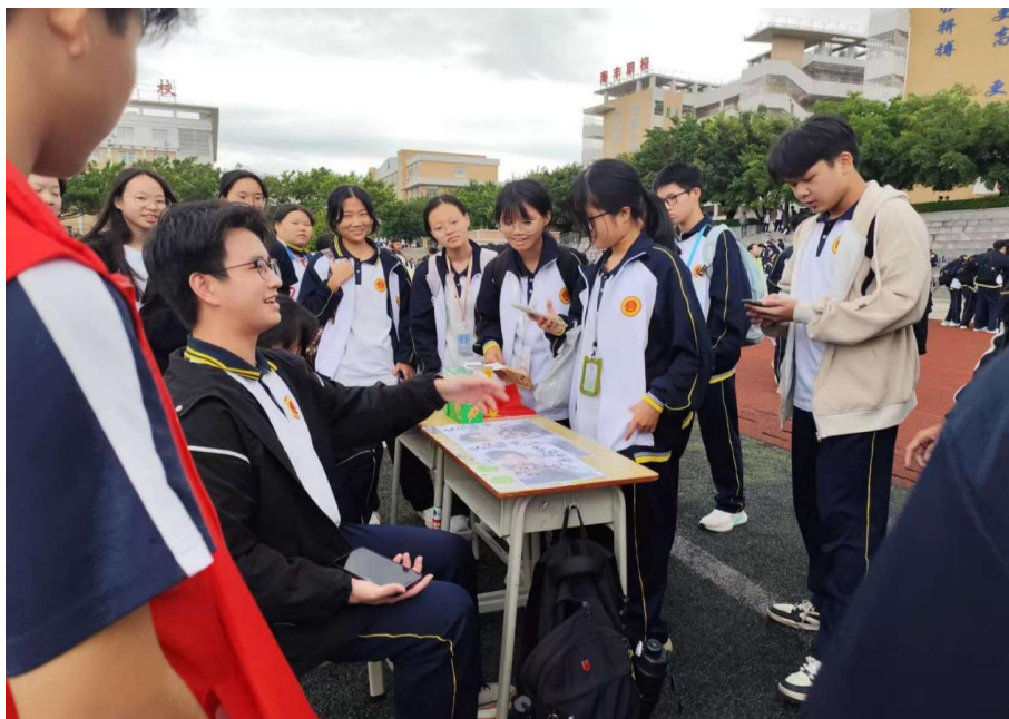
图2-11海丰县中等职业技术学校第四届学生社团节