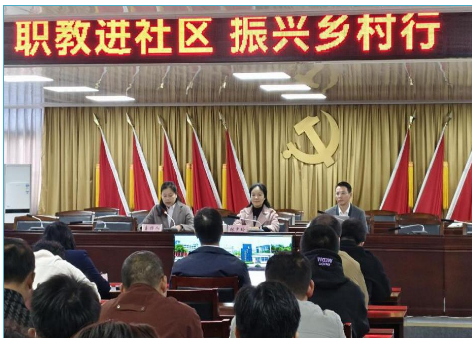
图 3-3 甲子镇村干部开设“职教进社区”专题培训

培训将职业教育资源直接输送至基层治理一线。通过理念宣讲与案例分析，启发了村干部对职业教育助力乡村振兴的新思考，增强了其利用现代技能服务乡村发展的意识，拓展了学校服务地方的形式与内涵。