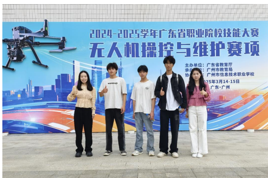
图2-8 无人机操控与维护赛项获奖学生

对口帮扶赋能结出的硕果，标志着学校在“以赛促教、以赛促学”方面取得了实质性进展。