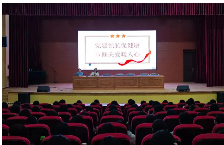
图2-5女生生理心理健康教育讲座

讲座取得显著成效，不仅帮助女生夯实了生理卫生保健知识、提升了心理健康防护意识，更助力其树立自尊自重自爱的价值观念，为职教女生健康成长筑牢保障，成为职业院校关爱学生身心发展的典型范例。