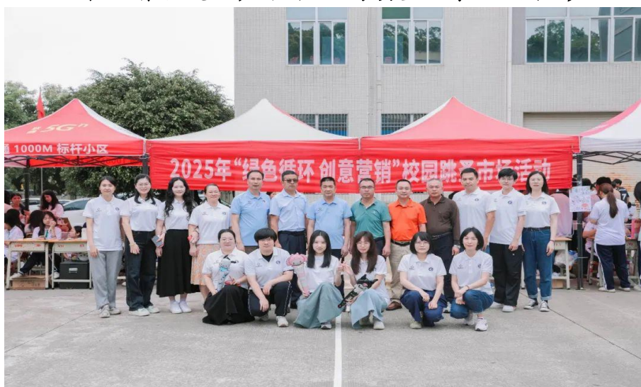
图2-7绿色循环创意营销跳蚤活动