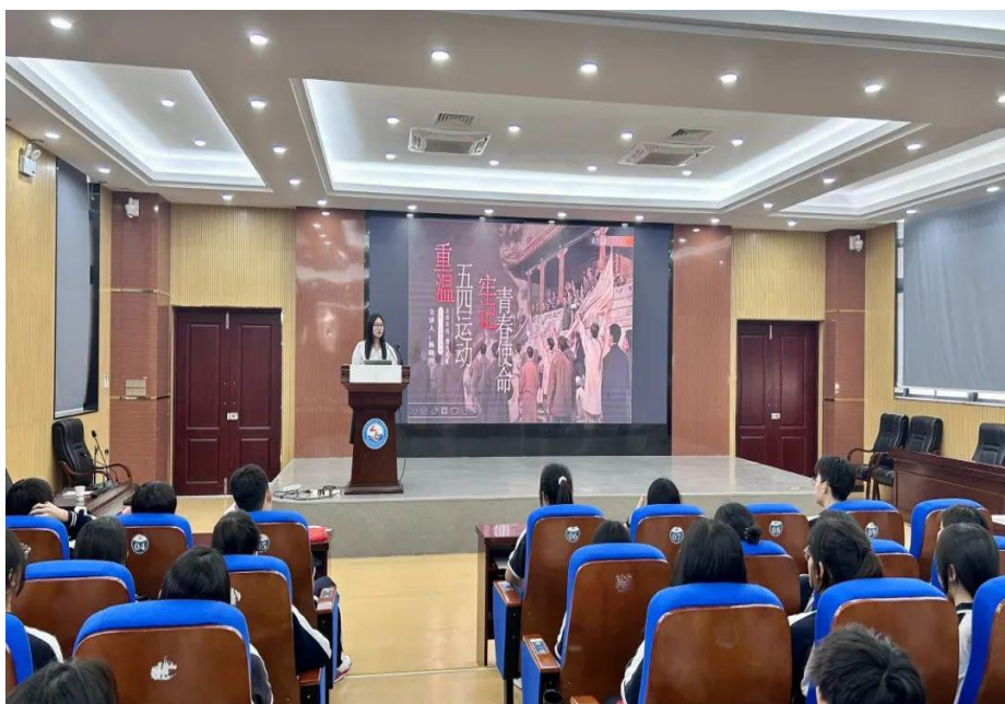
图 7-3 学校团委书记组织学生重温五四运动