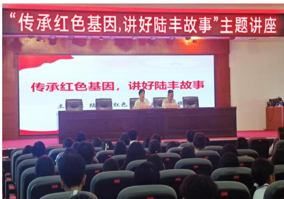
图 4-2 红色主题讲座

讲座通过革命历史的叙事，引导青年学子在思想认知上校准人生航向，增强了历史使命感与家国情怀，实现了红色文化在校园内的有效传承与价值引领。