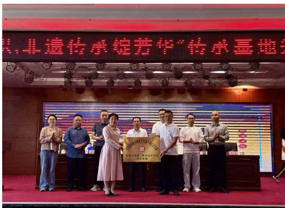
图4-3 市正字戏传承保护中心正式授予学校“传承基地”牌匾

同时，正字戏传承保护中心的艺术家们带来了《精忠报国》《百花赠剑》等经典选段表演，精湛技艺赢得满堂喝彩，此次活动是艺术与教育的深度融合，让师生近距离领略戏曲精髓。增强了师生的文化认同感与自豪感，给师生带来了视听与心灵的双重滋养。