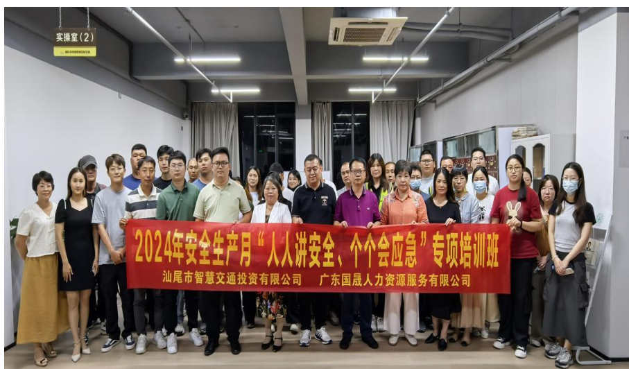
图 3-4 2024 年安全生产月专项培训

2024 年 9 月 20 日,海丰县中等职业技术学校教师积极参与了 2024 年安全生产月“人人讲安全、个个会应急”主题专项培训班。活动旨在助力参训人员切实增强安全意识,提升应急实操水平。培训内容丰富具有很强的实用性和针对性,培训还通过模拟火灾逃生、急救演练等实操环节,进一步巩固了培训成效,有效提升了全员应对突发事件的反应能力和协作水平,为安全生产形势持续稳定夯实基础。