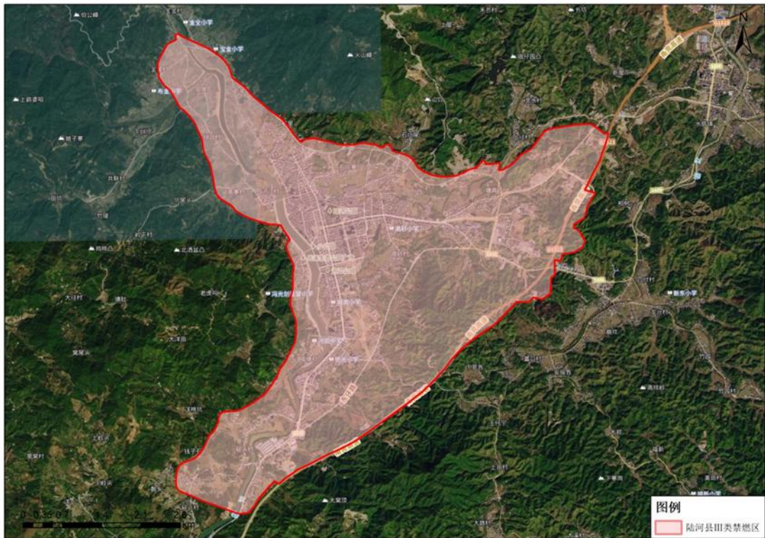
附图 4 陆河县 III 类禁燃区范围（执行《高污染燃料目录》III 类（严格）要求）