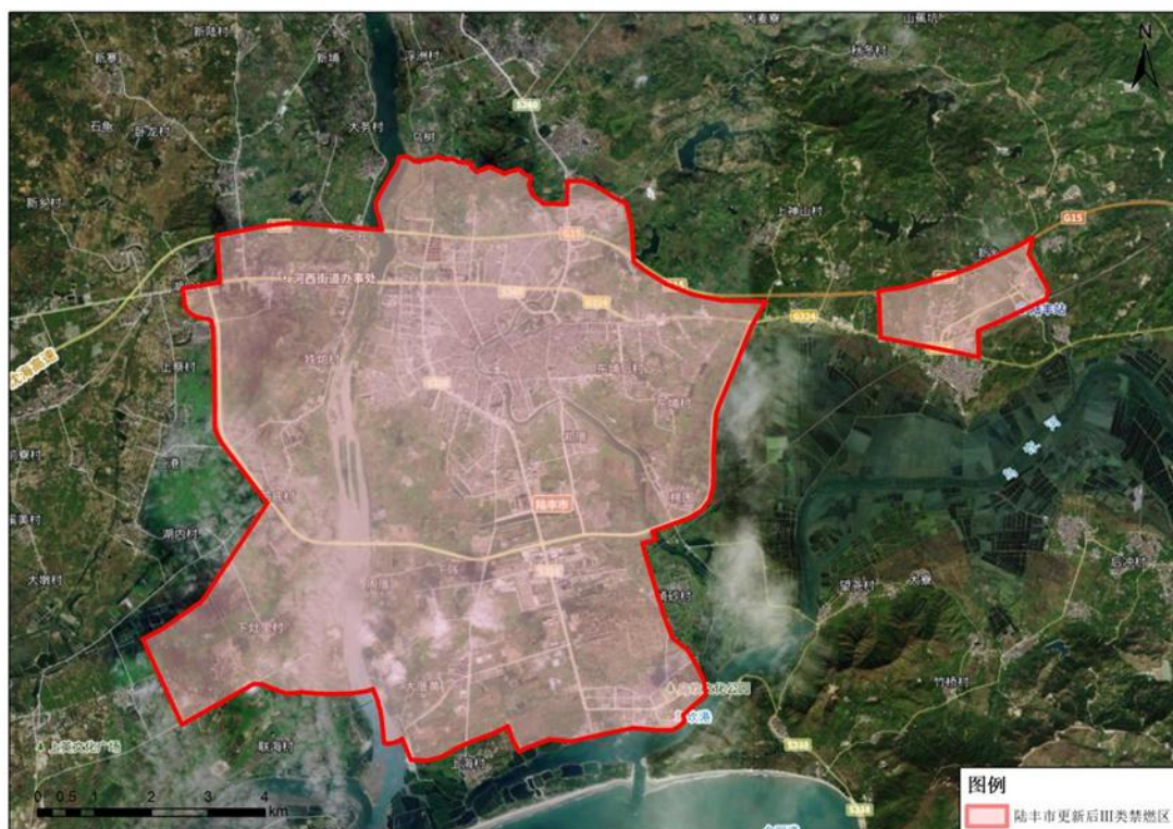
附图 2 陆丰市 III 类禁燃区范围（执行《高污染燃料目录》III 类（严格）要求）