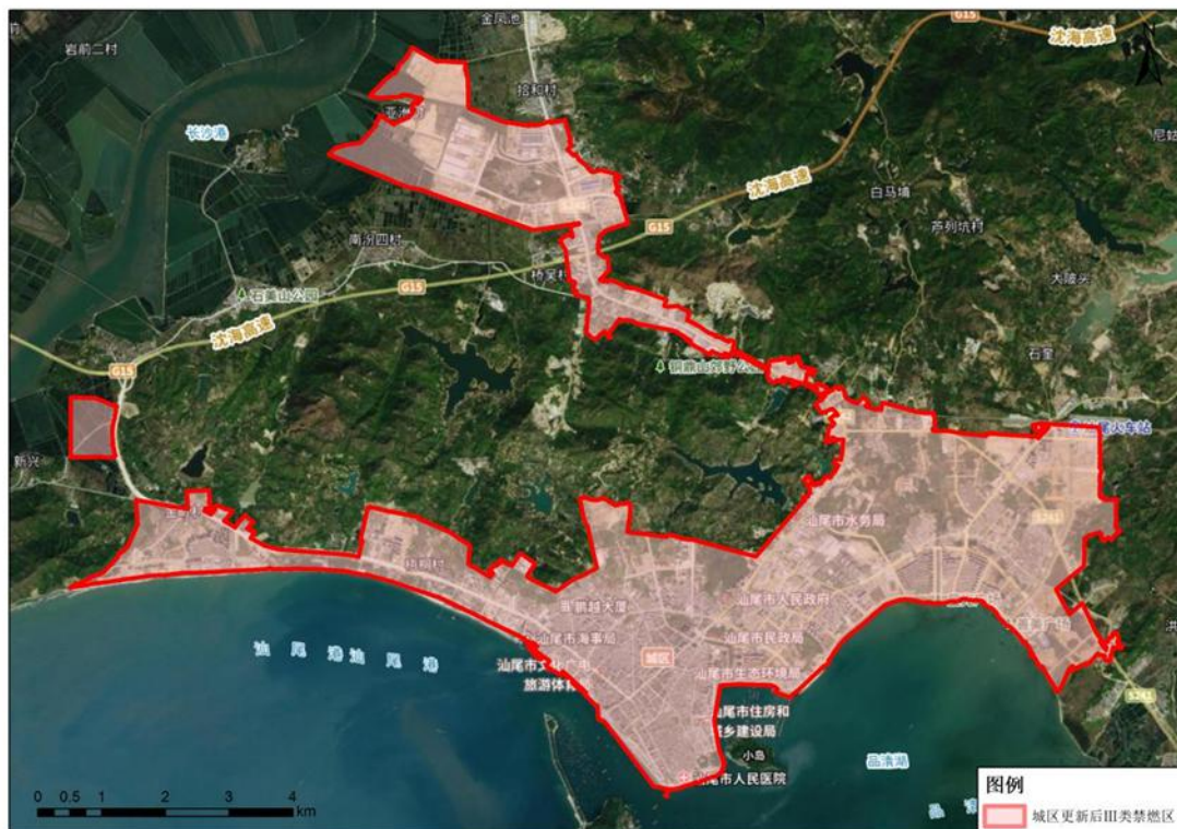
附图 1 汕尾市城区 III 类禁燃区范围（执行《高污染燃料目录》III 类（严格）要求）