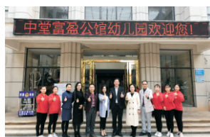
学前教育实习基地