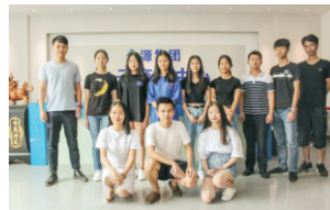
会计、电子商务实习基地