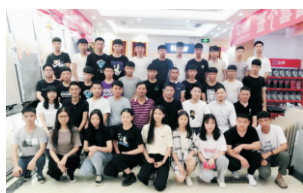
建筑装饰实习基地