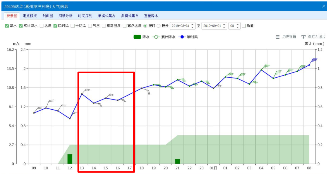
图 2：2019 年 8 月 31 日 14:00-16:00 大亚湾沱泞列岛降雨、风速情况

由于事发海域缺乏气象观测站，附近的海岛站沱泞列岛（北纬 22° 24′ 6″、东经 114° 61′ 7″）监测资料显示，8 月 31 日 15 时前后三门岛附近海域风力为 5 级左右（10 米/秒左右），未观测到降水现象。