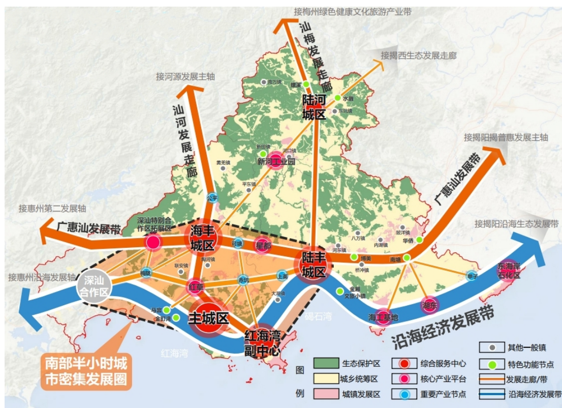
图 3 市域“一圈两带两廊”布局

交通要道，自南向北串联红海湾、汕尾主城区、汕尾高新区中心园区、海丰县城、公平镇等，加快打通南北向交通梗阻、破除要素流通障碍，构建汕河发展走廊，推动沿海经济发展带和广惠汕发展带融合发展，重点发展先进制造业和战略性新兴产业。依托兴汕高速等交通干线，自南向北串联陆丰城区、陆河县城、螺溪镇等，构建汕梅发展走廊，重点布局发展新能源汽车、新材料和绿色经济，推进产业生态化和生态产业化，着力提高生态安全保障和绿色发展能力。