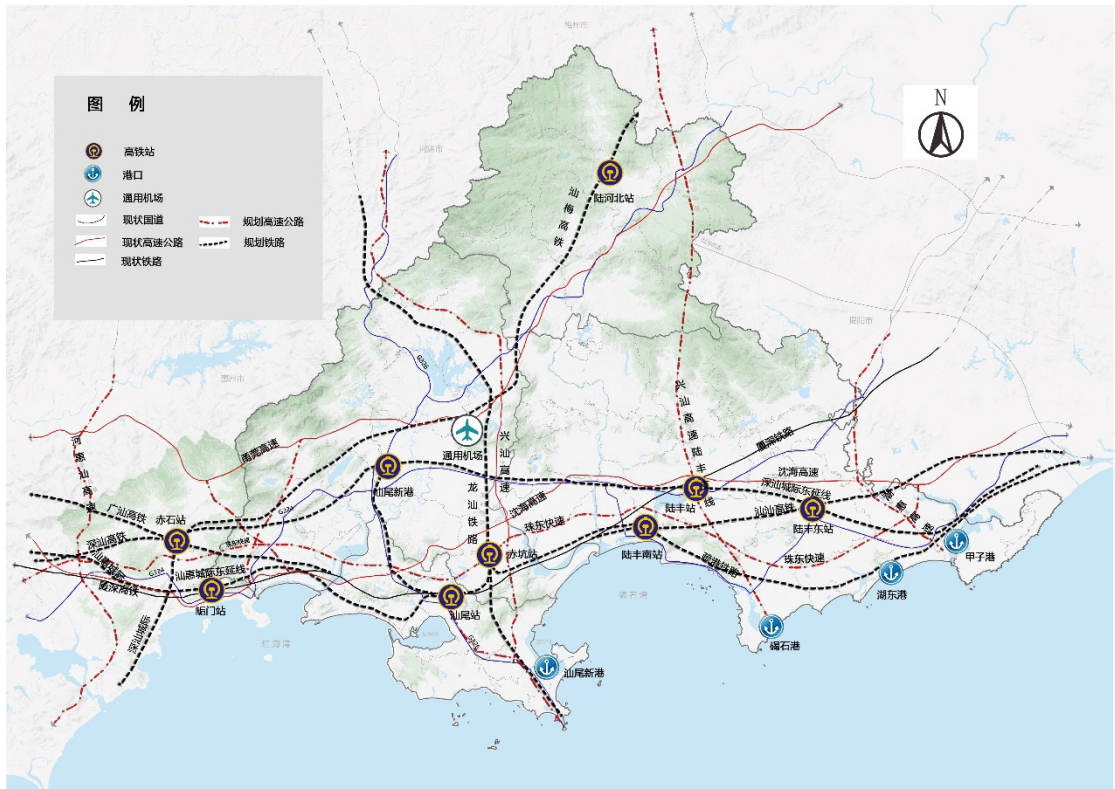
图 2 汕尾市“十四五”交通基础设施建设规划图