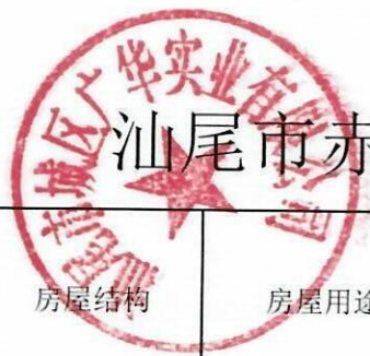
汕头市赤岭华夏东方项目4栋预售房屋明细（价格）表